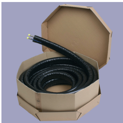
Kartonnen verpakking 800 x 800 mm