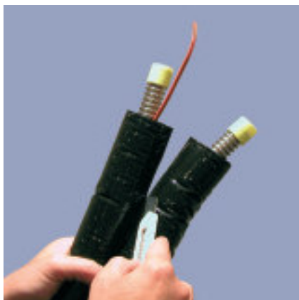
Flexibele leidingen, eenvoudig te scheiden